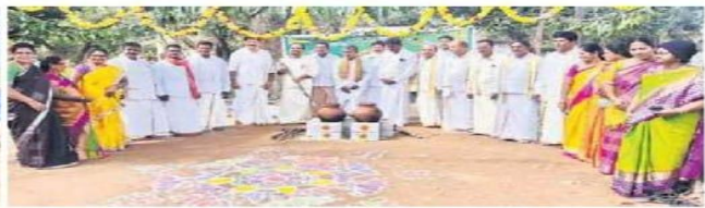
కుప్పం డిగ్రీ కళాశాలలో విద్యార్థులు, అధ్యాపకులు - సాంప్రదాయ వేషధారణలో డైట్ అధ్యాపక బృందం